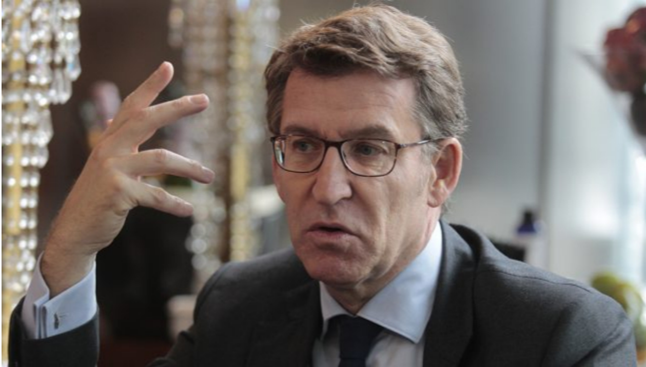
Alberto Núñez Feijóo

personal, profesional y socialmente". Afirma que , trsa dedicarse estos años a investigar y analizar los fallos con el fin de encontrar soluciones, ahora espera que quieran escucharla en las Instituciones.